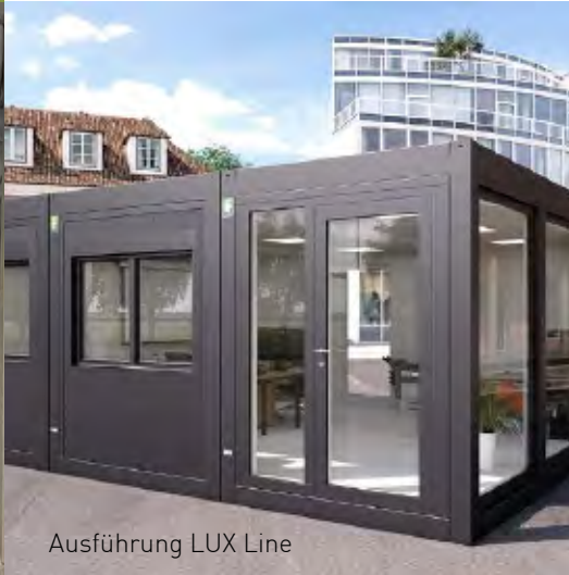
Ausführung LUX Line