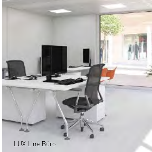
LUX Line Büro

Bei der Innenausstattung stehen Ihnen eine Vielzahl von Auswahlmöglichkeiten. Dies erstreckt sich hin vom Innendekor, Bodenbelägen, Beleuchtungssystemen, energiesparende Optionen bis hin zu den unterschiedlichen Innentritten aus Holz. Langfristige Raumlösungen finden Sie auch in unserer Lerch LUX Line Serie.