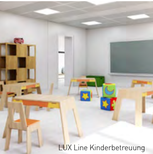
LUX Line Kinderbetreuung